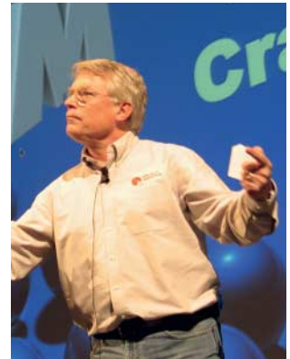
„Uncle Bob“ wirbt für testgetriebene Softwareentwicklung.

Das Interesse an der funktionalen Programmierung liegt in der Multi-Core-Programmierung begründet. Die Übergabe von Werten statt Objekten soll Inkonsistenzen verhindern, die sich dadurch ergeben, dass zwei Objekte gleichzeitig in einen Thread schreiben. Als Treiber sind Themen wie Serverkonsolidierung, Green-IT, steigender Admin-Aufwand und das Bedürfnis zu nennen, mehr aus sequenziellen Prozessen herausholen zu müssen. Die Konzepte funktionalen Programmierens sind nicht neu, doch im Gegensatz zu vor 20 Jahren liegen heute reifere Implementierungen und gute